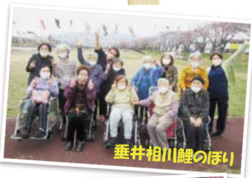
垂井相川鯉のぼり