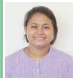
イー・イー・ピョ